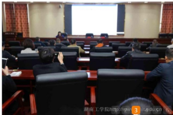
学校召开2018年财务预算执行情况通报会