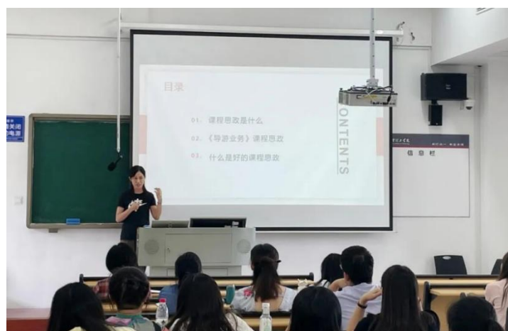
图 4 为商学院教师在开展课程思政研讨会

各二级学院积极组织举办课程思政元素挖掘讨论会，对《高等学校课程思政建设指导纲要》进行详细解读，从不同学科和专业讲解了如何构建科学合理的课程思政教学体系，引导教师深化认识，积极扛起课程思政建设责任，着力提升人才培养能力，全面形成广泛开展课程思政建设的良好氛围。