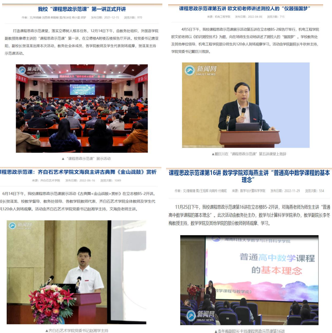
图 2 湖南科技大学课程思政示范课新闻稿（示例）