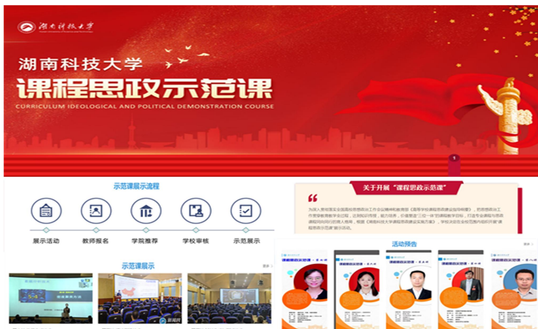
图 1 “课程思政示范课”示范平台